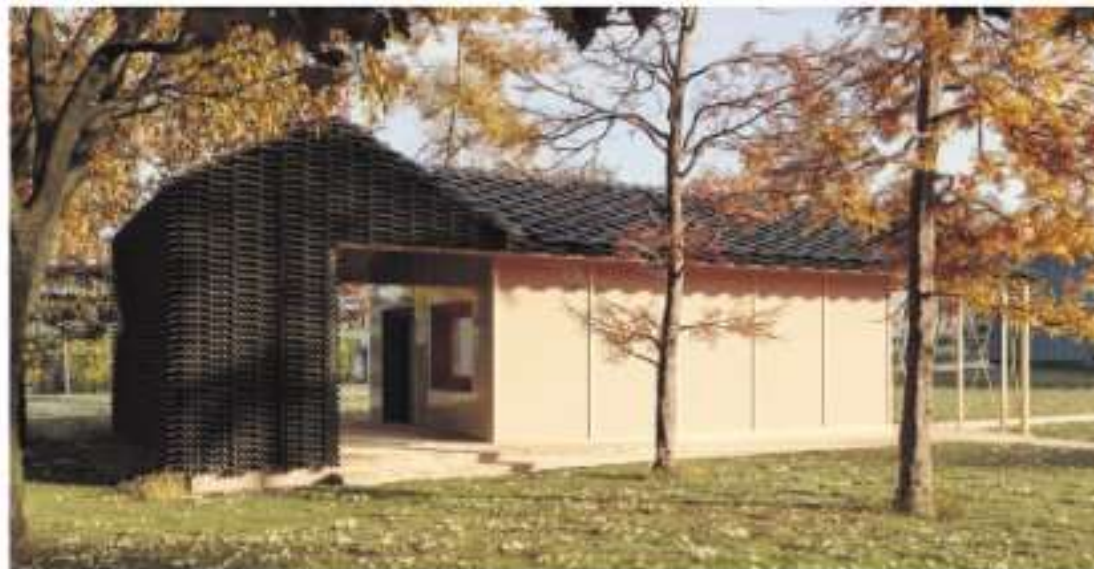
Hampens Hus opføres i Nykøbing Falster og giver mulighed for at teste hamp og afprøve nye typer af byggematerialer. Illustration: : Zanstudio v/ nikolova/aarsø

- Hampens Hus bliver én stor vidensbank, som vi sammen med mange vigtige partnere stiller til rådighed for alle, der vil være med til at skabe klimaløsningerne